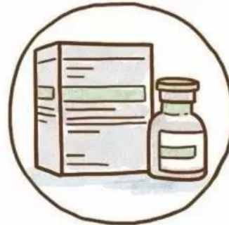
• 肿瘤免疫疗法, 例如抗PD-1免疫疗法